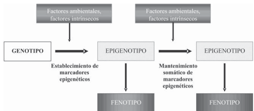
Figura 2. La unión dinámica entre el genotipo, epigenotipo y fenotipo (Feil, 2006).

Agentes contaminantes del medio ambiente, tales como los metales (arsénico) e hidrocarburos aromáticos (benzopireno), también pueden desestabilizar el genoma y modificar el metabolismo celular. Estos agentes tóxicos, se han encontrado en ambientes contaminados con sustan-